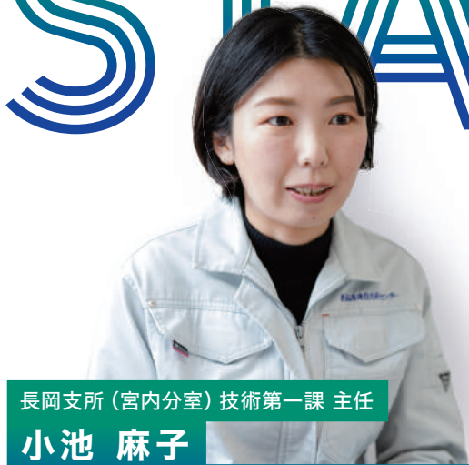
長岡支所（宮内分室）技術第一課 主任