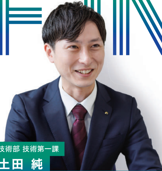
技術部 技術第一課

出身地の佐渡で暮らしていたころ、狭くて歩道もなく、危険を感じていた道路があったんです。佐渡支所勤務でその道にバイパスを作る工事に携わり、便利な道になりました。帰省して通るたびに「頑張ったかいがあった。地元の役に立てた」とうれしくなります。関わる分野も幅広く、掘り下げれば下げるほど多くを学べる仕事。興味があったら、ぜひ飛び込んできてほしいですね。