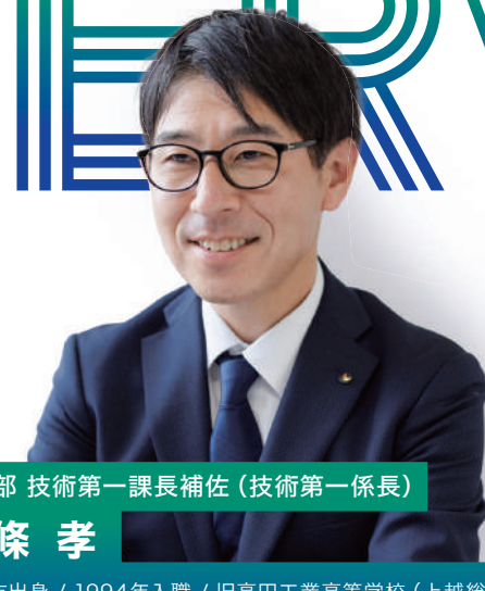
技術部 技術第一課長補佐（技術第一係長）

やる気を持ち、自主的にチャレンジする人は、より質の高い仕事ができます。次々と資格を取得し、スキルアップしていく同僚たちを見ると、「自分も頑張ろう！」と励みになりますね。地域に役立つ強い思いと、意欲のある人と一緒に仕事をすることを楽しみにしています。