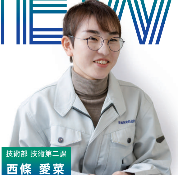
技術部 技術第二課

技術職だけでなく、総務の事務方の経験もあるんですよ。3年間、経理係長として法人の運営面をサポートしました。39歳で係長になってからは、若手職員のマネジメントがメイン業務。彼らの仕事のチェックと労務管理ですね。組織内にはいろんな立場の人がいます。それぞれの価値観の違いを理解し、共感することを大切にしています。うちの法人の仕事は一般には見えにくいですが、生活に欠かせない社会インフラ提供の一環です。地域住民の命を守り、暮らしを便利にする、やりがいの大きい仕事です。