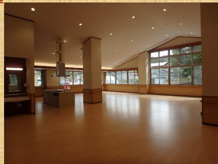
令和元年度 刈羽村自立支援施設建設工事 発注支援業務・工事監理業務

新潟県・各市町村における公共建築工事等の発注者支援機関として工事の発注から竣工検査・会計検査対応に至るまで各事務作業・監理等を効率的に支援いたします。