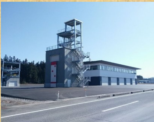
令和元年度 阿賀町消防署建設工事 発注支援業務・工事監理業務