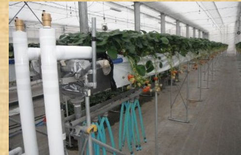
刈羽村 イチゴハウス地中熱利用設備工事 R元年度 発注者支援業務・工事監理業務