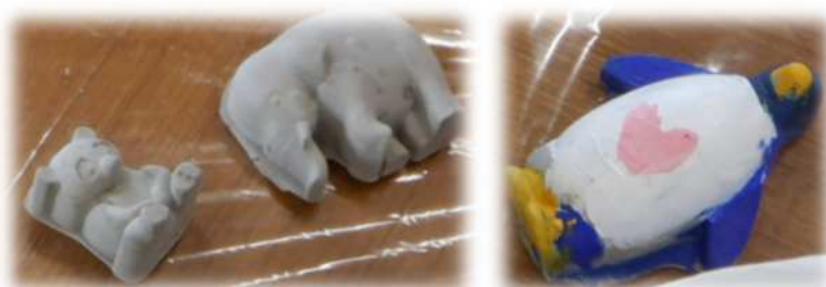
コンクリート製のペーパーウエイト