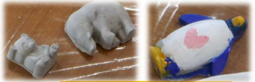
コンクリート製のペーパーウエイト